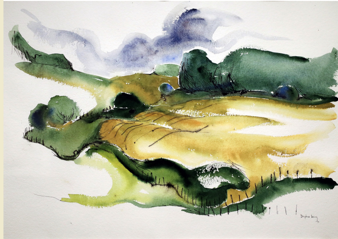
North River Hayfield Motif #1, 1974, watercolour on paper, 49.3 x 69.5 cm. Purchase, 1976, Collection of Confederation Centre Art Gallery, CAG 76.12

“The process is very intuitive...not thought out. This way it releases colours and shapes below the logical mind...the more I have trusted my intuition the more I get expressive shapes.”